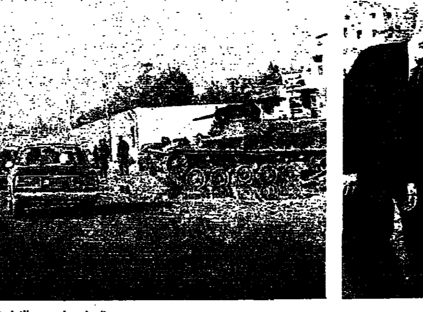
الجنود عند جسر الولى